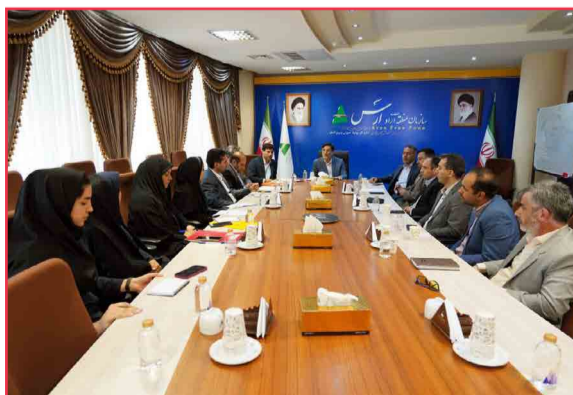
ارس می تواند بعنوان الگوی ملی در مباحث گردشگری و زیست محیطی مطرح شود / محیط زیست ضرورت ملی و تکلیف شرعی است