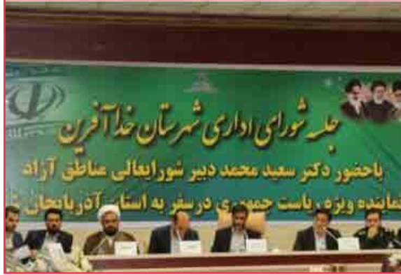
در نشست شورای اداری شهرستان خداآفرین مطرح شد: تاکید مدیرعامل سازمان منطقه آزاد ارس بر توسعه متوازن در همه زون های ارس