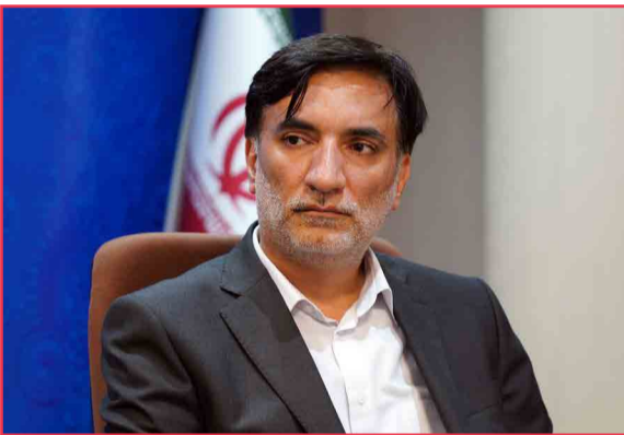
ناکستان مدرن ۳۰ هکتاری در محدوده خداآفرین منطقه آزاد به بهره برداری رسید