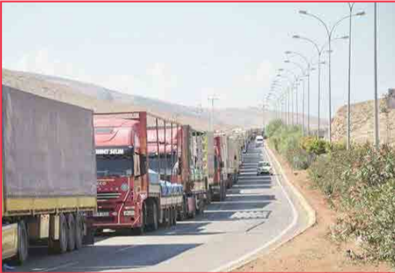
توسعه ترانزیت و لجستیک بین المللی بعنوان یکی از استراتژی های اصلی توسعه متوازن ارس لحاظ شود