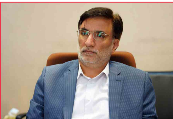
کیانی: لازمه حل مشکلات ارس، تامین رضایتمندی فعالین اقتصادی و امنیت کاری پرسنل است / باید ریشه های تولید فساد را در ارس قطع و خشک کنیم