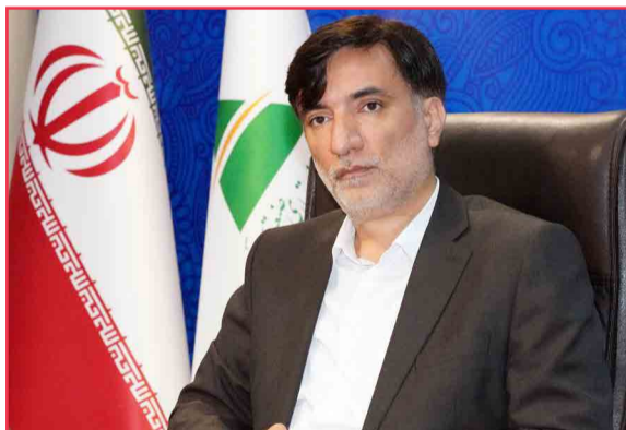
مدیرعامل سازمان منطقه آزاد ارس از فعال سازی سامانه های الکترونیک املاک و شهرسازی، سامانه سرمایه گذاری و سامانه فروشگاهی در ارس خبر داد