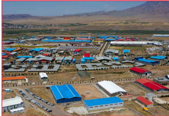
کیانی خبر داد: کارگروه های ویژه رسیدگی به مشکلات واحدهای صنعتی و تجاری ارس تشکیل می شود