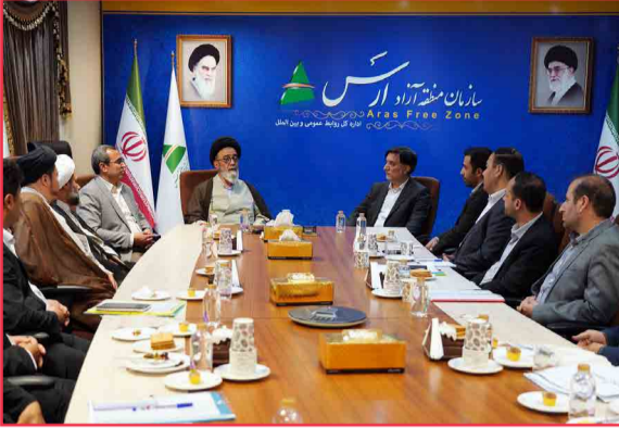
نماینده ولی فقیه در آذربایجان شرقی در دیدار با مدیرعامل ارس؛ از کارنامه تان گویاست قطعا در مدیریت ارس موفق خواهید شد