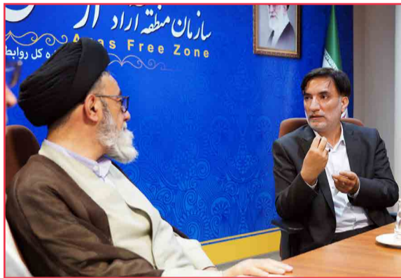
کیانی در دیدار با نماینده ولی فقیه در استان: تکمیل حلقه رشد ارس نیازمند همکاری و هماهنگی تمامی نهادهاست